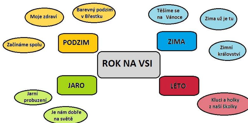
obr. 2.: Schéma tematických celků

Integrované bloky jsou časově plánovány na delší časový úsek, proto si je dále dělíme na menší složky – „tematické celky“ (zkr. TC). Tyto celky si učitelky zpracovávají konkrétně a podrobně ve svých třídních vzdělávacích programech dle pěti vzdělávacích oblastí.