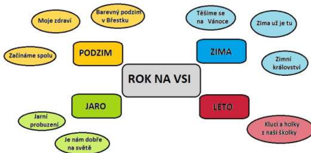
obr. 2.: Schéma tematických celků

Integrované bloky jsou časově plánovány na delší časový úsek, proto si je dále dělíme na menší složky – „tematické celky“ (zkr. TC). Tyto celky si učitelky zpracovávají konkrétně a podrobně ve svých třídních vzdělávacích programech dle pěti vzdělávacích oblastí.